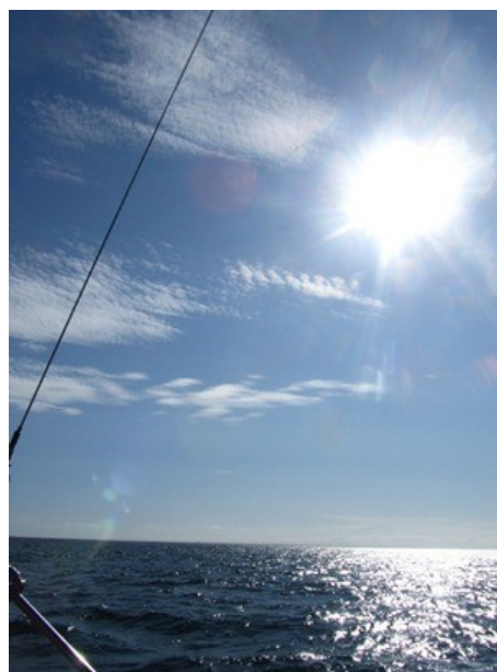
Endnu en smuk dag på den store blå hylde

Vi har på 21 dage sejlet 532 sømil, vi har haft mere sol og varme end gråvejr og regn. Vi har besøgt 17 havne – 15 forskellige, og vi er stadig meget tilfredse med det gode skib Freja.