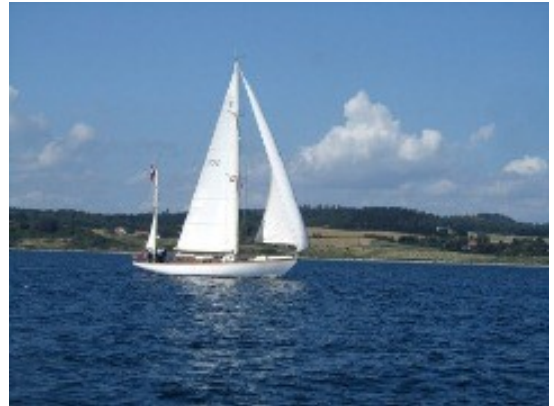
Thyra – eller måske Svanen

Omstændigheder vi ikke selv er herre over, gjorde at vi skulle være i Gentofte den førstkommande lørdag. Vi valgte derfor at satse på at nå Århus senest fredag. Vejrudsigten var ikke særlig gunstig til den plan, så for at få enderne til at nå sammen besluttede vi at sejle Aalborg - Grenå i et stræk. Det gik over al forventning, og vi kunne tilbagelægge de godt 77 sømil på 13½ time inkl. ventetid ved Limfjordsbroen – der var ikke trængsel da vi gik igennem kl. 6 onsdag morgen. Grenå har en rigtig dejlig lystbådehavn, det er bare enormt dyrt at ligge der, måske fordi der ikke er så mange alternativer. Vejret var ok, og vi sejlede for sejl det meste af turen. Vi mødte forsvarets 2 smukke sejlskibe Thyra og Svanen. Alle søofficerer starter vist deres karriere med at påmønstre disse smukke skibe, for at lære og forstå vind og vejr.