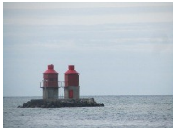
Salt og Peber – sømærker ved indsejlingen til Hals

Hals er foruden en aktiv fiskerihavn også en ferieby med masser af liv, og vi kunne nyde en dejlig frokost på en af havnens hyggelige caféer.