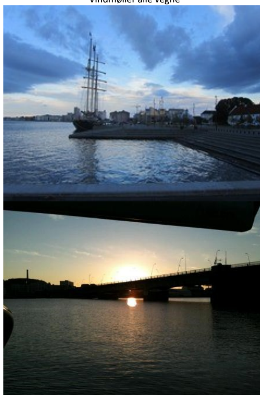
Aften og morgen i Aalborg