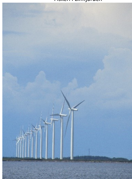
Vindmøller alle vegne

Lige meget hvor man sejler i Limfjorden, synes det som om der er udsigt til en (eller mange) vindmøller.