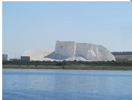
Limsten i Limfjorden

Var vi på sommertogt som denne gang gik til Limfjorden Læs mere om den tur andet sted.