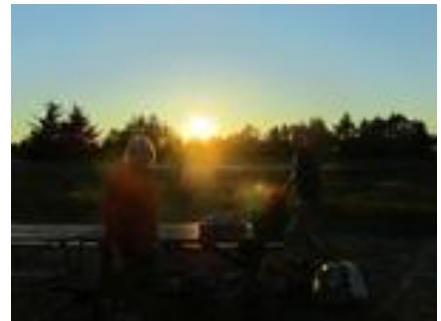
Sol over Båggø

Søndag havde vi en dejlig tur for fulde sejl til Båggø, der ligger ved Assens. Her var vi bestemt ikke alene, men fik en fin plads og hyggede os med andre sejlere på grillpladsen.