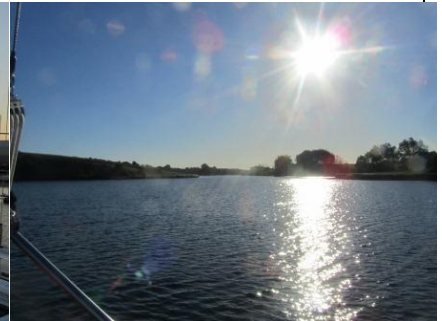
Dyvig i september