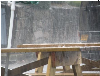
Middelfart Gammel Havn