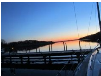
Augustenborg en kold aprilmorgen