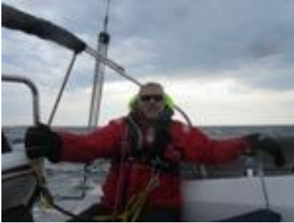
"Efterårsvejr" i april