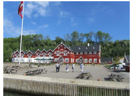
Dyvig Badehotel og havn

Søndag havde vi en dejlig tur for fulde sejl til Båggø, der ligger ved Assens. Her var vi bestemt ikke alene, men fik en fin plads og hyggede os med andre sejlere på grillpladsen.