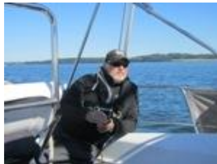
På vej til Bogense