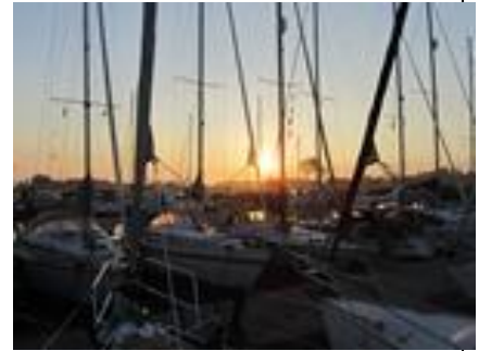
Trængsel på Årø

Vejret var rigtig dejligt, især søndag, hvor vi sejlede retur i strålende sol, og medvind. Vores log var i udu, men der var ikke meget krydssejls i disse dage, så det har været i omegnen af 34 sømil