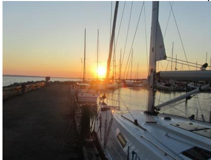
Limfjorden i juli

Læs også om årets sommertogt som gik til Limfjorden, hvor vi havde 3 ugers ferie, og i sensommeren var vi i Middelfart, Assens og på Årø.