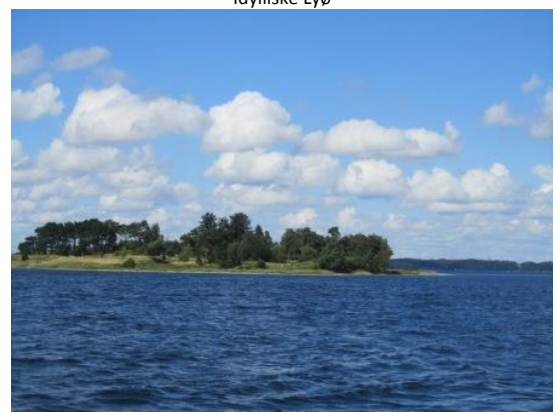
Så er vi næsten hjemme - vi runder Fænø Kalv

Onsdag satte vi så kursen mod Skærbæk, og i løbet af eftermiddagen fandt dette års sommertogt så sin afslutning.