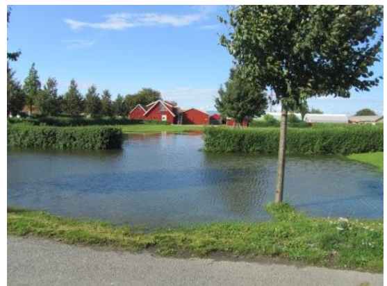
Marstal har fået "Nye søer" i løbet af natten

Tirsdag ville vi til Lyø - det er virkelig en perle i det syd fynske øhav. Lyø har 150 indbyggere, egen skole og en velfungerende landsby. Lyø har fx ingen sommerhus udstykninger. Da vi kom, kunne vi konstatere at havnen er blevet udbygget til det dobbelte, så her sidst på sommeren var der masser af plads.