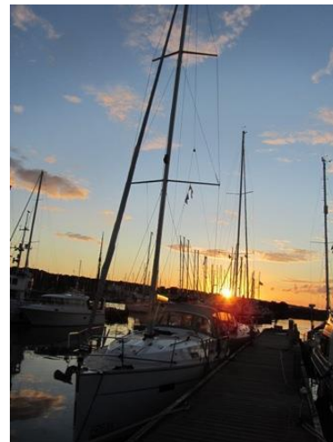
Endnu en betagende solnedgang

vis vi skal nå hjem inden ferien er slut, skal vejret til at vise sig fra en for sejlere bedre side, og det ser nu ud til at ske fra torsdag morgen. Godt nok lovede de at det vil blive kraftig vind fra sidst på eftermiddagen, så vi stod op kl. 5 og lagde fra kaj ved halv syv-tiden. Turen over Køge bugt kan være noget af en udfordring, hvis vinden er ugunstig, men vi var heldige og havde en god sejlads, selv om det regnede hele dagen. 7 timer og 34 sømil senere kunne vi fortøje i 2. position i Rødvig fiskerihavn.