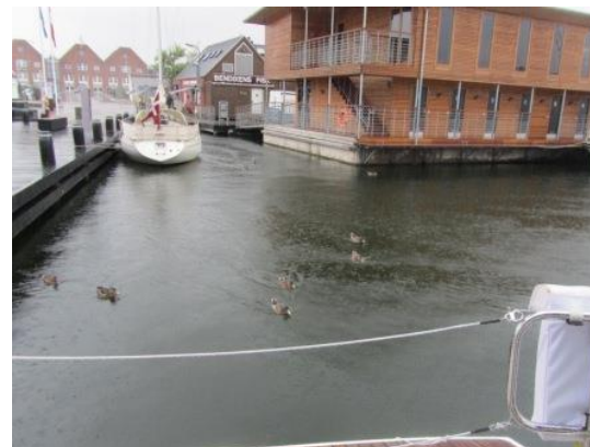
Tæt på regnvejr i Svendborg

Fra Karrebæksminde tog vi lørdag igen til Lohals, hvor både vejr og vind var perfekt, og vi kunne igen finde grillen frem, og nyde en dejlig sommeraften. Søndag tog vi til Svendborg - en lille tur på 16 sømil i dejligt vejr. Det er tydeligt at vi nu er kommet på den anden side af skolernes sommerferie, så der var bare frit valg på næsten alle pladser i Svendborg havn, så vi kunne lægge til på langs, lige foran havnekontoret, så det var rigtig dejligt. I løbet af et par timer, trak himlen sig sammen, og det blev til et regnvejr af de større. Dagen efter kunne vi i aviserne læse at store dele af Fyn stod under vand, men næste morgen var det klaret op, og vi kunne sætte kursen mod Marstal på Ærø i solskinsvejr.