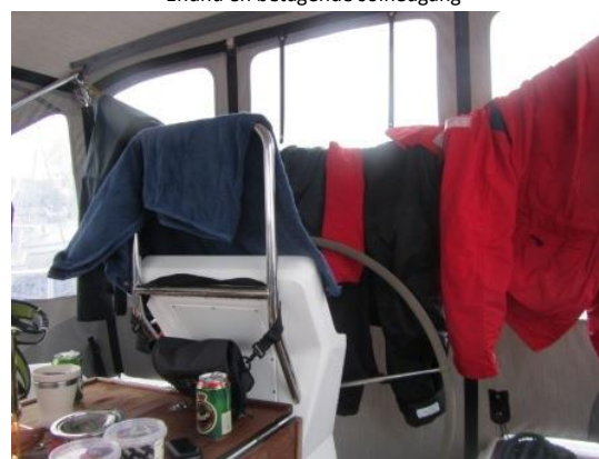
Godt vi har kalechen, hvor vi kunne hænge alt det våde tøj til tørre.

Den nye båd stikker næsten ½ meter dybere end den gamle, så vi havde forberedt os på, at vi skulle uden om Møn, men undervejs havde vi talt med flere, som med samme dybgang havde taget turen gennem Bøgestømmen, så efter en snak med havnefogeden og et studie af højvandstabeller besluttede vi at forsøge os med Bøgestrømmen om fredagen. Det gik også fint. Vinden var perfekt, og for forsejl alene tog vi turen fra Rødvig til Karrebæksminde/Søholm 48 sømil på 9 timer det er meget tilfredsstillende. Igen en dag med regn og rusk, men i løbet af eftermiddagen klarede det nu op, og blev en rigtig dejlig aften.