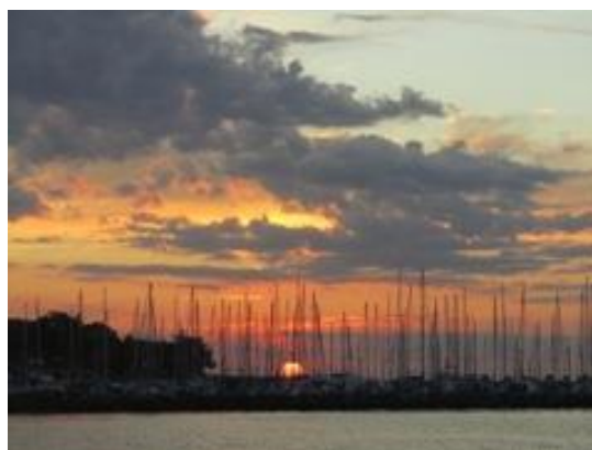
Solnedgang i Ærøskøbing

Søndag havde vi på forhånd bestemt skulle være en "overligger-dag" pga. vejrudsigten, som dog ikke blev så blæsende som forudsagt, og vi fandt derfor cyklerne frem, og var turister for en dag. Bl.a. var vi inde og se Flaske-Peters udstilling af 1700 hjemmelavede flaske- og modelskibe. Vejret var skønt, og badetøjet blev også fundet frem - og brugt