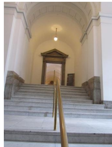
Man må ikke fotografere inde på Christiansborg, så I må nøjes med trappen

Tirsdag pumpede vi cyklerne og fandt en Metrostation i nærheden, og så tog vi toget til Hillerød og besøgte mormor, som heldigvis er i god bedring. På vejen tilbage cyklede vi ind til farmor og fik eftermiddagskaffe. En dag med sol og en masse vind - godt vi ikke var på vandet. Onsdag var også en overliggerdag, og vi legede turister i København, og fik endelig set de fantastiske gobeliner på Christiansborg Slot - imponerende.