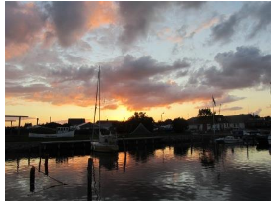
Himmel og hav i Marstal