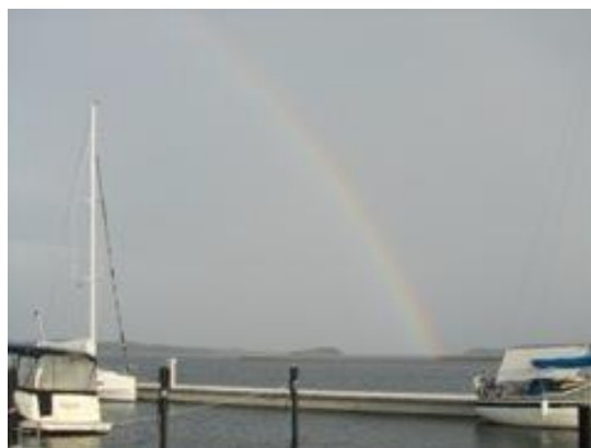
Sol og regn over Skærbæk

Vi var klar fra morgenstunden, og kursen blev sat mod Ærøskøbing. Det er en lang tur, men vejret og vinden var perfekt, så vi havde en dejlig tur ned gennem Lillebælt og Det sydfynske øhav, og efter knap 8 timer havde vi tilbagelagt de 45 sømil, og kunne lægge os i Ærøskøbings gamle havn hvor vi bestemt ikke var alene - vi lå i 3. position, men tæt på byen, så det var rigtig fint.