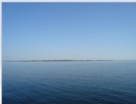
Himmel og hav i Smålandsfarvandet

2009 blev også året hvor vi måtte tage afsked med vores morfar, som døde i februar.